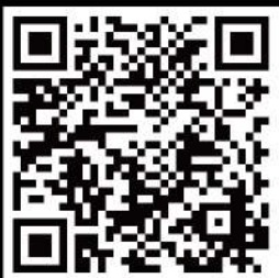
運動課程定型化契約

報名本中心課程前， 請詳閱報名須知及課程相關規定， 報名即同意中正運動中心運動課程定型化契約。 完成報名手續後，其法律效力及於報名人， 報名人事後不得以不知或未瞭解等事由作為抗辯理由。